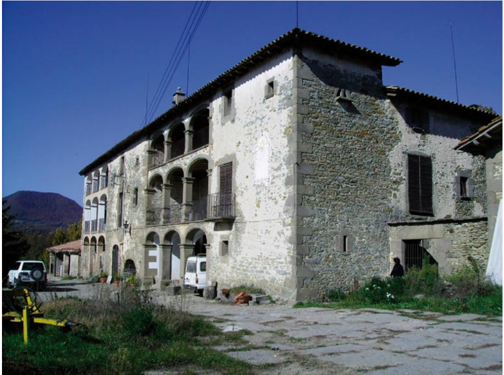
Figura 2. La Sala (Rupit, Collsacabra).

Tenint en compte els objectes distribuïts entre els tres edificis , es pot deduir que la casa principal estava destinada als amos, amb un nivell de vida acomodat, mentre que la resta, a l'elaboració de vi i oli, ja que conté un gran celler amb premsa i cups de roure.